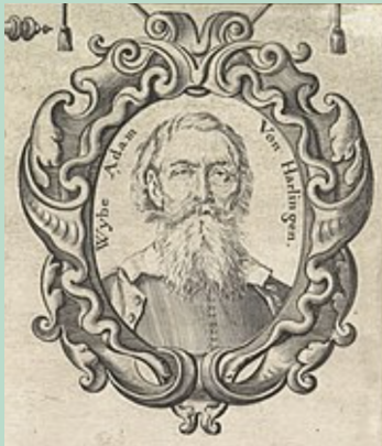
Portret Adama Weeba Willem Hondius

Z powodu prześladowań emigrowali ze swej ojczyzny m.in. do Rzeczypospolitej. Jako że słynęli z gospodarności i byli dobrze obeznani z budową systemów melioracyjnych, katolicy magnaci i hierarchowie Kościoła chętnie osadzali ich w swoich dobrach. Menonicy zamieszkiwali przede wszystkim Żuławy i inne tereny nadwiślańskie aż po Sandomierz, a polska ludność z powodu ich holenderskiego pochodzenia nadała im miano olędrów.