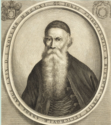
Portret Jonasza Szlichtynga, teologa braci polskich Lambert Visscher

W 1562 r. doszło do rozłamu w szeregach polskiego kalwinizmu, wskutek czego od zboru większego (właściwej wspólnoty kalwińskiej) odłączył się zbor mniejszy, którego członków zaczęto nazywać arianami (nazwa nawiązująca do doktryny teologicznej Ariusza, prezbitera Kościoła w Aleksandrii z IV w. n.e., odrzucającej dogmat Trójcy Świętej) lub antytrynitarzami (gr. anty + łac. trinitas – przeciw Trójcy), choć oni sami wolli używać określenia bracia polscy. W 1658 r. sejm uchwalił ich wygnanie z Rzeczypospolitej. Część braci polskich udała się na emigrację, część – jak np. poeta Wacław Potocki – zdecydowała się na powrót do katolicyzmu.