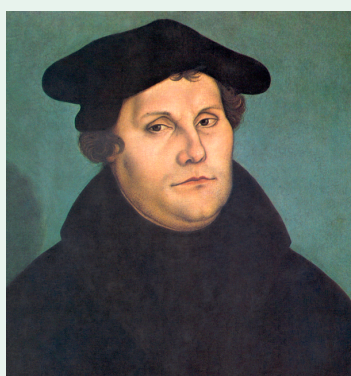
Portret Marcina Lutra Lucas Cranach Starszy.

Napływał do Polski przede wszystkim przez Śląsk i Prusy Książęce. W tych ostatnich powstał w 1544 r. uniwersytet w Królewcu, w którym studiowała także młodzież z Polski i miała tam styczność ze środowiskiem reformacyjnym. Luteranizm w Polsce zdobył popularność głównie wśród niemieckich mieszkańców miast. W Wielkopolsce około 20% luterskich zborów było pod zarządem Polaków, reszta pozostawała pod zarządem niemieckim. Wśród szlachty zyskał on pewne wpływy jedynie w Prusach Królewskich, wśród chłopów natomiast – na Śląsku Cieszyńskim, znajdującym się wówczas pod władzą dynastii Habsburgów jako część państwa czeskiego.